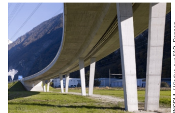
INGPHI / Viaduc sur l'A9, Remiaz Image © Yves André Architectes: B + W Architecture

JE 15 mai à 18h30 Conférences de deillon delley et fastt Entrée libre, ouverture des portes à 18h