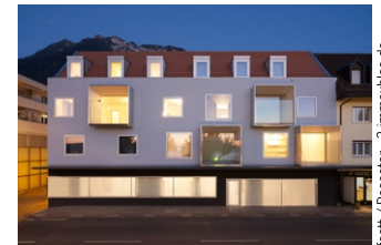
fastt / Pescator - 3 immeubles de logements, Villeneuve

MA 29 avril à 18h30 Vernissage et conférence de Simon Deppierraz Entrée libre, ouverture des portes à 18h