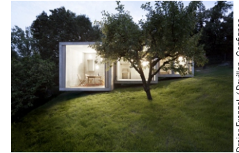
Dreier Frenzel / Pavillon, Confignon