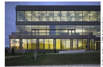
deillon delley / CP Automabon, Villaz-S-Pierre