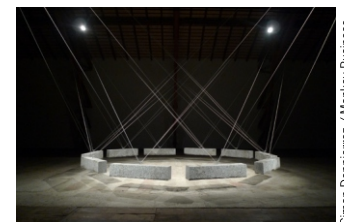
Simon Deppierraz / Monkey Business Image © Simon Deppierraz