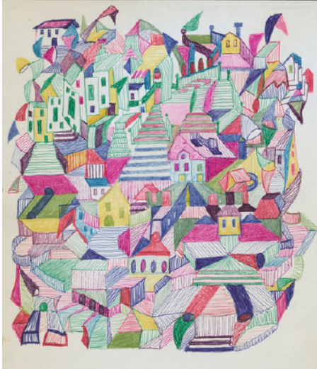
< Collection de l'Art Brut à Lausanne biennale Architectures