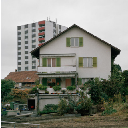
< Michael Blaser, photographe à Bern, photographies de paysage ordinaire